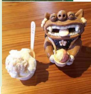
アイスクリームは屋久島の食材を使ったぞらうみというお店がおすすめてですよ!