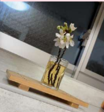
強風で折れて道路にあった枝をだめもどでもって帰ったら味きました